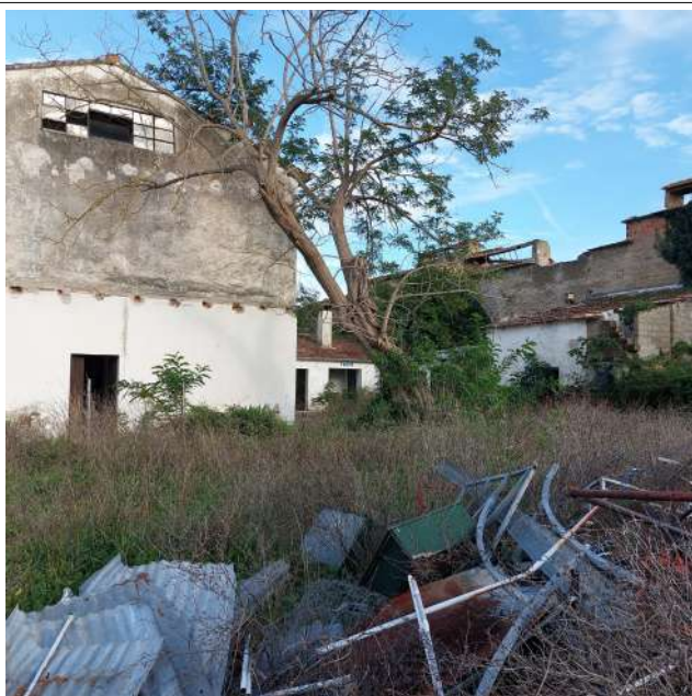
Edificio 03 da recuperare