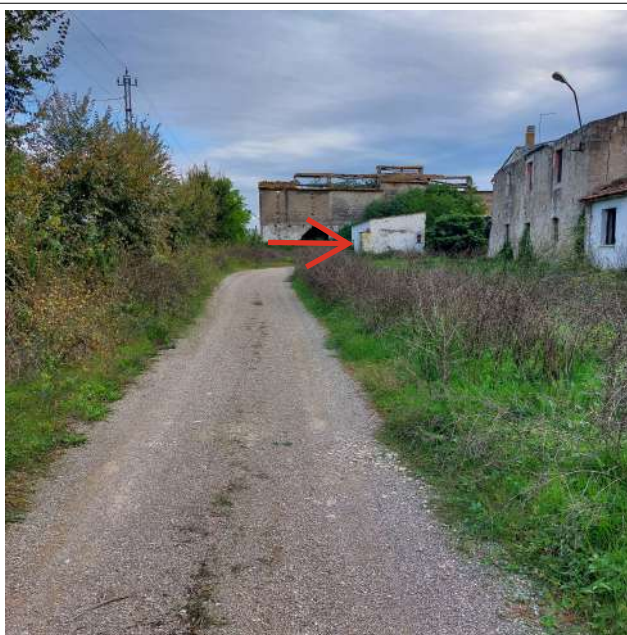
Edificio 04 da recuperare