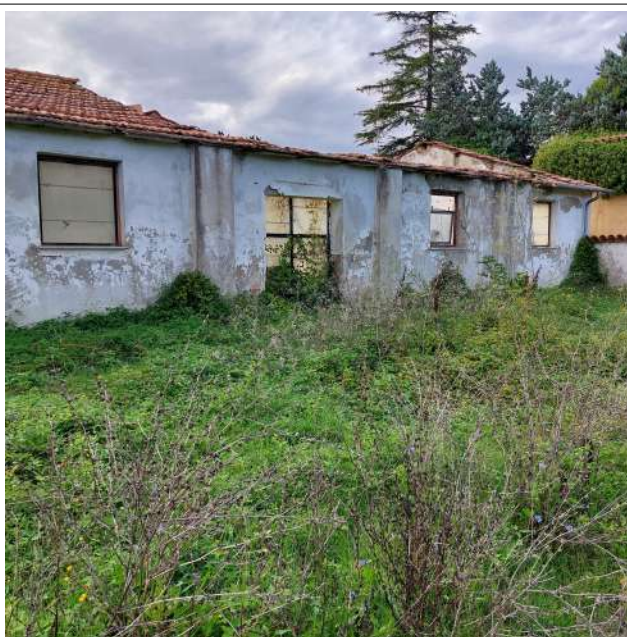
Edificio A da demolire e ricostruire