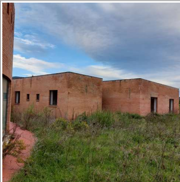
Edificio 07 da recuperare